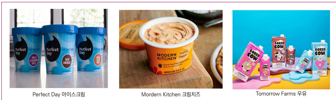
그림 3. Perfect Day 유청단백질 활용 아이스크림, 크림치즈 및 우유