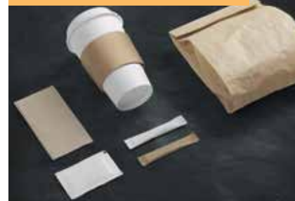
식품포장기자재전(Coex FOOD PACK)